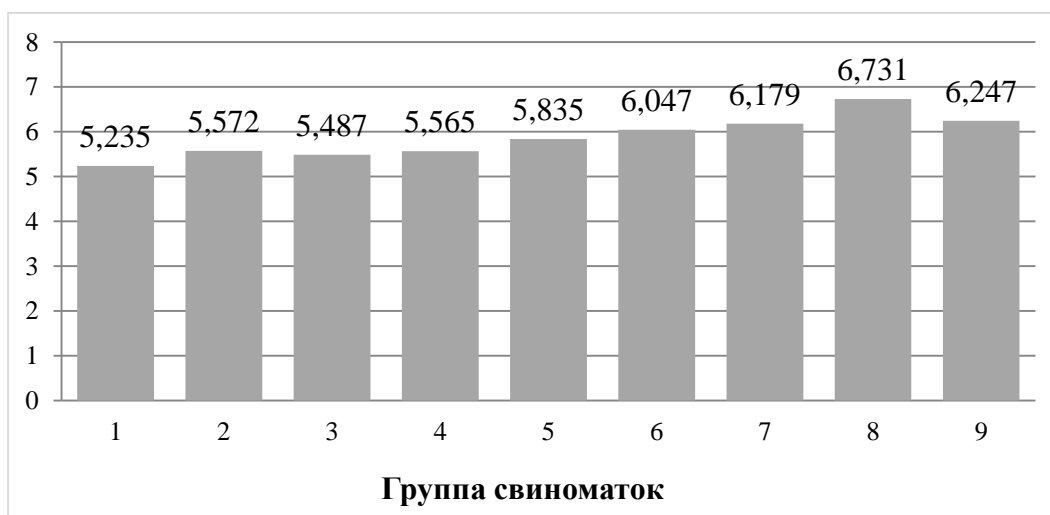
Рисунок 2 – Живая масса поросят при отъеме, кг

При отъеме поросят в 18 дней, при сервис-периоде 1-7 дней, средняя масса поросят при отъеме составила 5,235 кг, что было меньше на 0,337 кг, чем при использовании свиноматок с сервис-периодом 21-28 дней ( P < 0,05 ). При использовании группы свиноматок с сервис-периодом 45 дней и более отъемная живая масса составила 5,487 кг, что больше на 0,252 кг, чем у группы свиноматок с сервис периодом 1-7 дней (рис. 2).