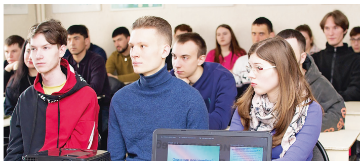
Студенты на занятии по оказанию доврачебной помощи

— Проведение Недели качества — давняя традиция университета. Подобные мероприятия способствуют оптимизации работы со студентами, обо-